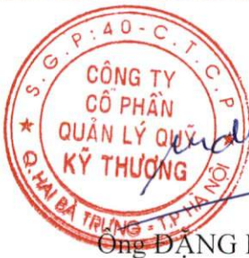
Ông ĐẶNG LƯU DŨNG